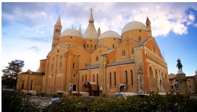
Basílica de Sant Antonio de Pàdua